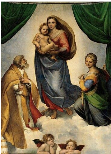
գ. Սիքստինյան Տիրամայրը (1512-1513) 1508)